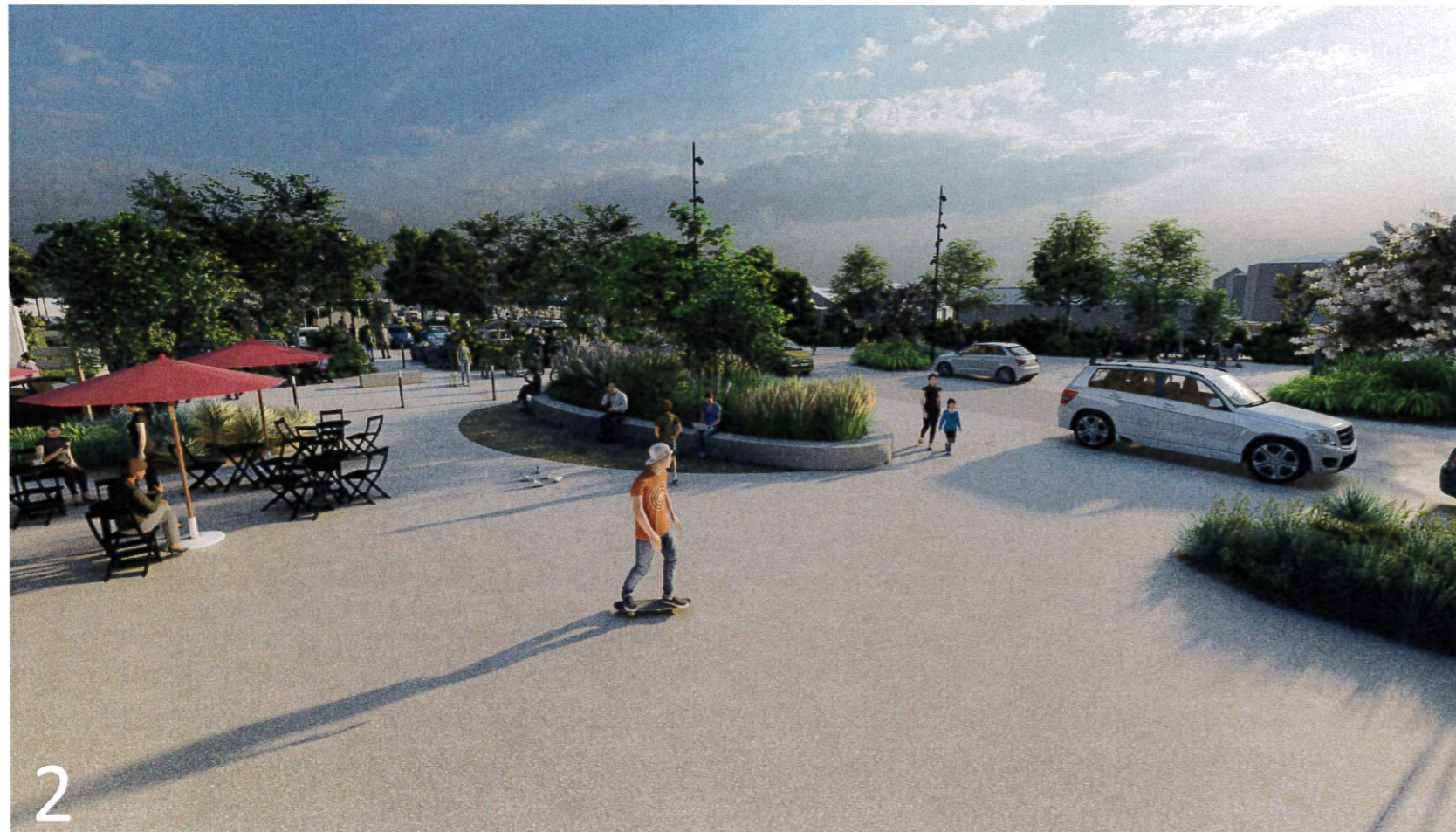
Extrait du plan PRO