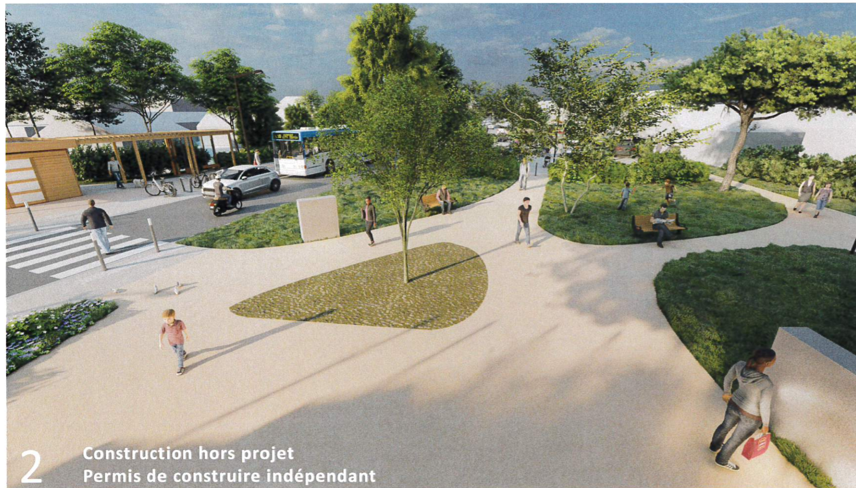
Construction hors projet Permis de construire indépendant