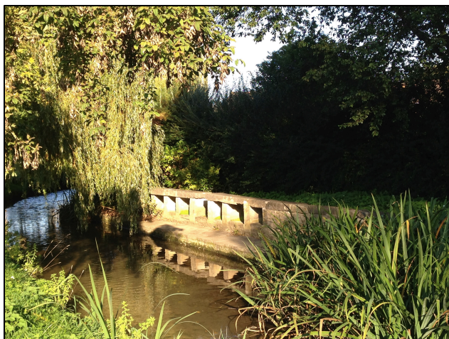
Le lavoir sur la Gronde (fin XIX e siècle)

En 1390, il existe à l'embouchure de la rivière qui traverse Asnelles, la Gronde, un petit port creusé dans la tourbe, le port des Heurtaux, dans lequel viennent mouiller des bateaux qui font du cabotage côtier. On estime à environ 1800 le nombre de ces bateaux qui s'y ancrent en 1540. Sans doute la création d'un Tribunal de l'Amirauté à Asnelles, chargé de juger des différends entre gens de mer, est-elle due à ce port qui sera comblé par une tempête en 1676.