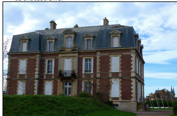
Le château SNCF

En juillet 1919, la mairie apprend qu'une société américaine souhaiterait installer un préventorium à Asnelles, recevant des enfants susceptibles de tuberculose. Le projet est abandonné, mais en 1925 l' Œuvre des Chemins de fer français le reprend. La municipalité est contrainte de s'exécuter, et, de 1928 à 1939, plus de 2000 enfants séjournent, pour se refaire une santé, dans de grands bâtiments fonctionnels qui se situeraient aujourd'hui le long du boulevard de la Mer. Très endommagés par les opérations du Débarquement, ces bâtiments sont arasés dans les années 50, mais leur propriétaire, le Comité d'entreprise de la SNCF, achète avec les dommages de guerre qu'il perçoit, une grande propriété (dite le Château d'Asnelles ), située à l'extrémité de la rue de Southampton, qui offre aux enfants de cheminots des séjours durant l'été