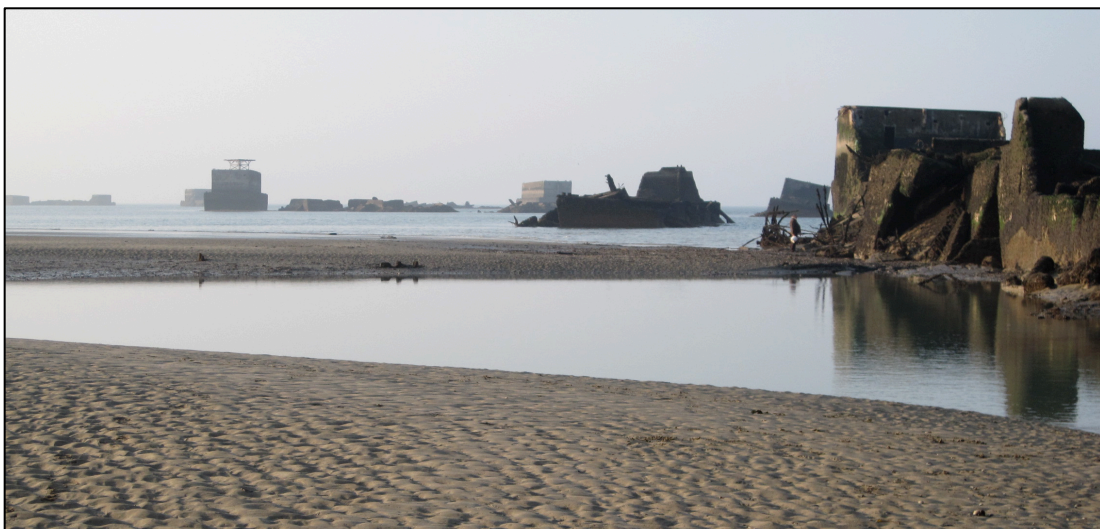
Vestiges de Port Winston

Le Débarquement allié est précédé de bombardements qui redoublent d'intensité dans la nuit du 5 au 6 juin 1944. Les premières troupes britanniques débarquent à Asnelles (nom de code Jig Green ) à 7 heures 25 le 6 juin, notamment le 1 er Régiment du Dorset, le 1 er Régiment du Hampshire, le 2 e Régiment du Devon, et le 47 e Commando des Royal Marines. Le canon du blockhaus (place Mosnier) qui n'a pu être neutralisé par les bombardements, cause de nombreuses pertes. Par chance, le courant de la marée va entraîner les barges à fond plat vers la plage de Meuvaines où s'effectue l'essentiel du Débarquement. Les premiers blessés britanniques et allemands sont soignés dans l'église : une inscription (au-dessus de la porte de la nef) rappelle qu'elle fut le premier abri-hôpital du Débarquement.