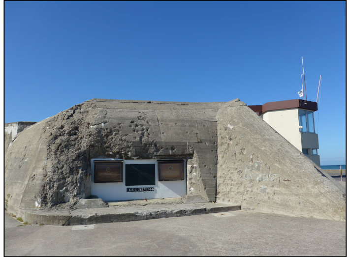
Le blockhaus de la place Maurice Mosnier

Le Débarquement allié est précédé de bombardements qui redoublent d'intensité dans la nuit du 5 au 6 juin 1944. Les premières troupes britanniques débarquent à Asnelles (nom de code Jig Green ) à 7 heures 25 le 6 juin, notamment le 1 er Régiment du Dorset, le 1 er Régiment du Hampshire, le 2 e Régiment du Devon, et le 47 e Commando des Royal Marines. Le canon du blockhaus (place Mosnier) qui n'a pu être neutralisé par les bombardements, cause de nombreuses pertes. Par chance, le courant de la marée va entraîner les barges à fond plat vers la plage de Meuvaines où s'effectue l'essentiel du Débarquement. Les premiers blessés britanniques et allemands sont soignés dans l'église : une inscription (au-dessus de la porte de la nef) rappelle qu'elle fut le premier abri-hôpital du Débarquement.