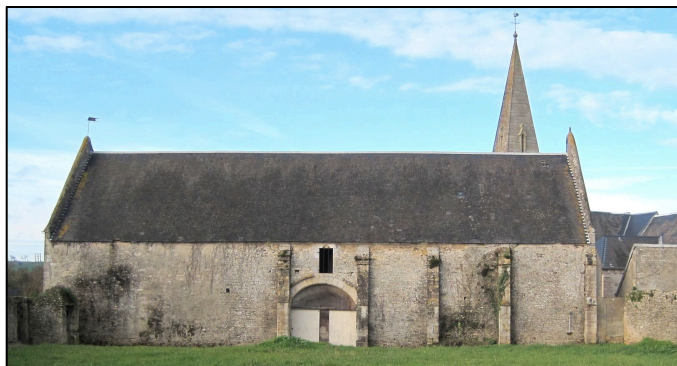
La grange à dîme