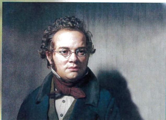
Franz SCHUBERT ©HadiKarimi-Creative-Commons-Grand